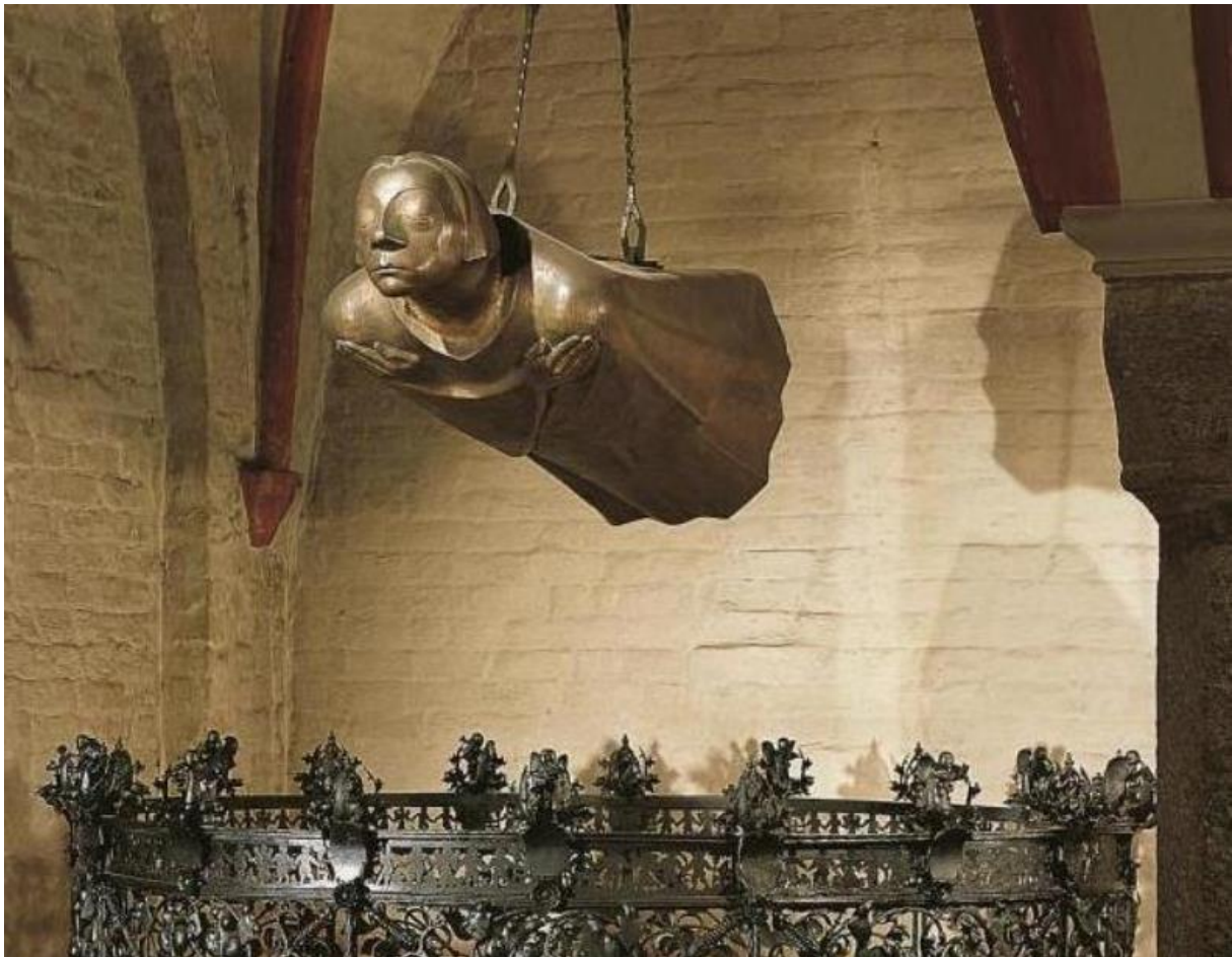
Zwevende engel, monument voor de Eerste Wereldoorlog in de Dom van Güstrow, 1927