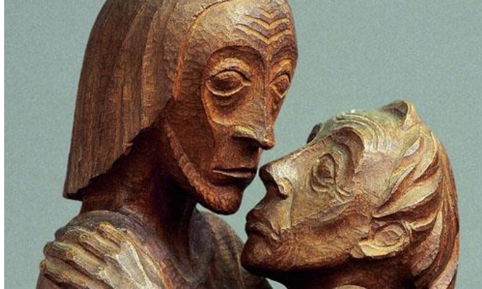
Het weerzien (Christus en Thomas), 1926, detail

Ernst Barlach, Geloof van de dichter, 1930/31